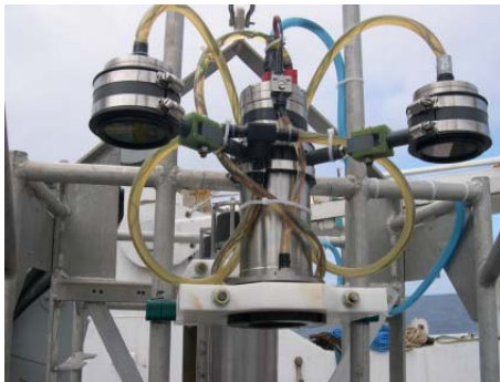
MOB 0, détail de la caméra photo et des 2 projecteurs à LED

MOB0 est constitué d'une structure aluminium (récupération d'un mouillage halieutique Prosper), de 2 largueurs acoustique (AR391 n° 24 et 25), d'un caisson énergie ASSEM. La prise de vue est assurée par l'appareil photo Hytech développé pour Victor avec stockage des photos en local équipé d'une carte de pilotage (OSEAN). Le hublot de la caméra est équipé du système antifouling (ERT/IC, Micrel). Deux projecteurs à LED (Dynasub) fournissent l'éclairage nécessaires et sont pilotés par la carte OSEAN. Un des projecteurs est équipé du système antifouling. Celui-ci, n'ayant pas fonctionné en laboratoire, a été déconnecté avant le mouillage. Le mouillage est également équipé d'une balise argos (25843), d'un gonio (canal 73, 156.675 MHz) et d'un flash fixés sur la lentille en mousse syntactique.