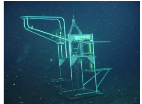
MOB 0 sur le fond, campagne Exomar