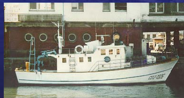
Lura – 14,3 m