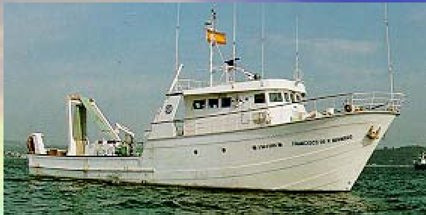
F.P. Navarro – 30,5 m