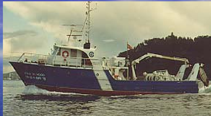
Odón de Buen – 24,0 m