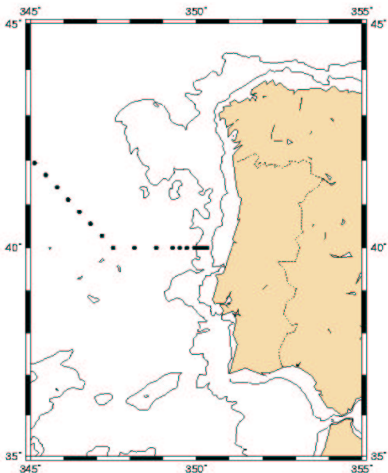
Figure 2 : Position nominale des stations hydrographiques réalisées lors de la campagne OVIDE 1 en juin 2002 et prévues dans le cadre de la campagne OVIDE 2 en juin 2004. La position des stations est indicative. Elle pourra être modifiée au cours de la campagne en fonction des conditions de circulation océanique rencontrées. Les travaux dans la zone économique du Portugal (limite des 200 NM) seront effectués entre 39°N et 41° 50'N.