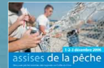
Organisation des premières assises de la pêche