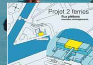
Analyse et visualisation d'un projet de développement d'un pôle passagers