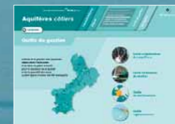
Réalisation d'un portail d'information sur les aquifères côtiers