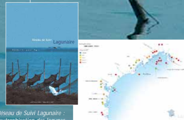
Bulletin du Réseau de Suivi Lagunaire : suivi de l'état d'eutrophisation des lagunes

Interface entre le monde scientifique, professionnel et les institutions, le Cépralmar joue un rôle fédérateur dans la mise en œuvre de réseaux de collecte et de transfert des "connaissances" et des "savoirs" vers les différents acteurs du développement littoral. Dans cet objectif, il organise la concertation entre les acteurs en proposant une restitution adaptée de l'information, afin de favoriser les échanges entre les partenaires. Enfin, il coordonne l'élaboration de réponses appropriées et concertées à destination des collectivités publiques et des professionnels.